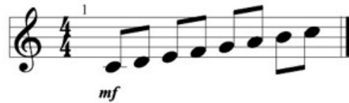
Figur 1 Traditionell västerländsk notskrift 1

Det finns exempel på notskrift så tidigt som ca 1800-talet f.Kr i Babylon men den traditionella västerländska notskriftens system med horisontella linjer började utvecklas på 1000-talet av en munk vid namn Guido av Arezzo (Hanning, 2010).